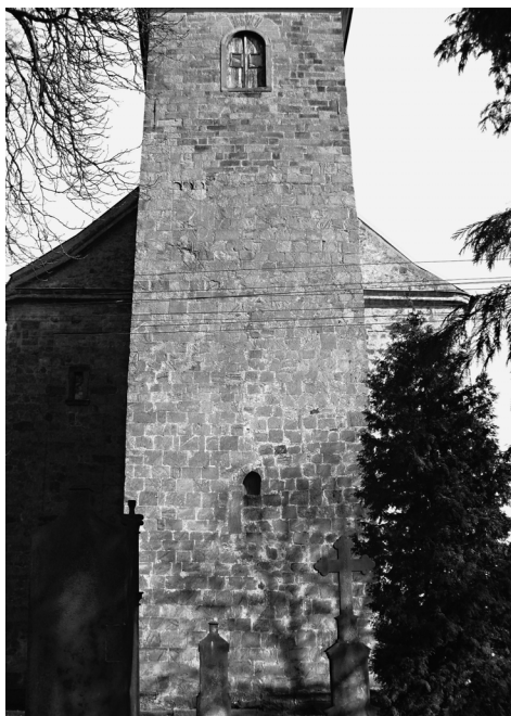
Obr. 2. Románská věž kostela sv. Jiljí v Železnici od západu. V její dolní čtvrtině je patrný zbytek vstupního portálu, který sloužil pro vlastníka sídla a jeho rodinu.