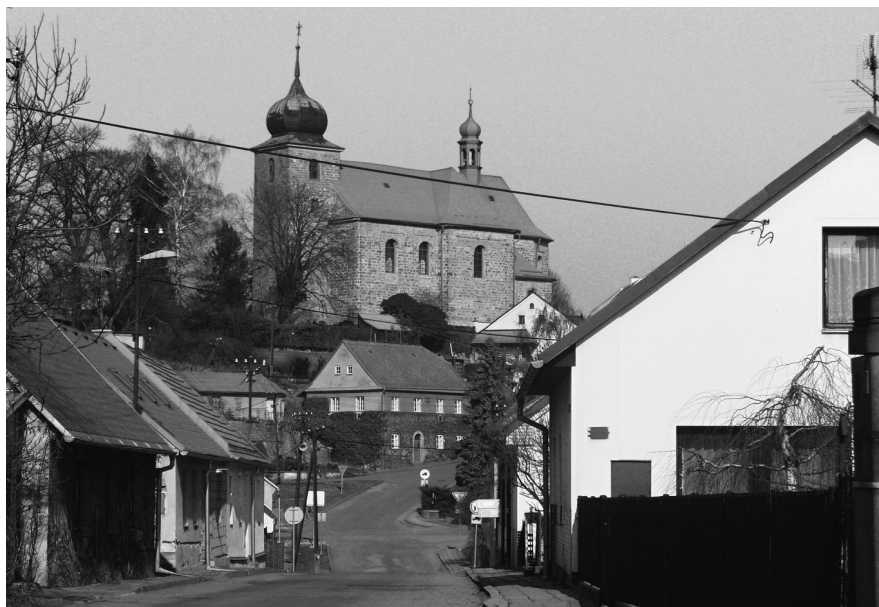
Obr. 1. Návrší s kostelem sv. Jiljí v Železnici – někdejší prostor rodového sídla pánů z Železnice.