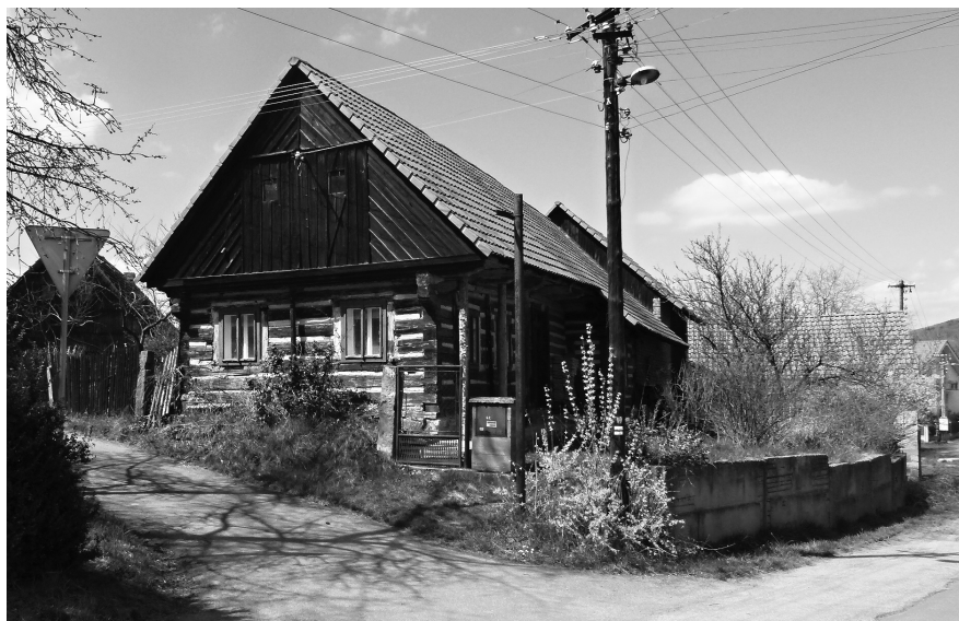
Obr. 4. Roubený dům čp. 62, který stojí na místě tvrze ze 14.–16. století.

jež nepochybně fungovala ještě v 16. století, zachovaly na pozemcích čp. 62 a 63. 59 Na základě této premisy lze uvažovat, že k přesunu sídla došlo ještě za původních pánů z Železnice a ne až za pánů z Turgova, jak se někdy také uvádí, že došlo ke změně sídla na základě změny majitelů, 60 neboť i archeologické nálezy z bývalého tvrziště začínají již druhou třetinou 14. století. 61